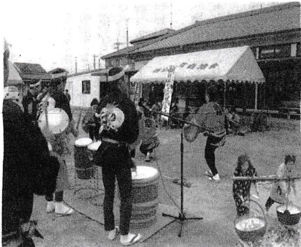
八木節の演奏・吊し鍋のふるまい

西暦二千年を前にして、我が西新井町の伝統行事文化祭が、今年十一月六日、七日の二日間開催され、四半世紀の時を刻みました事は喜びに耐えられません。 思えば昭和五十年の菊花盆栽展（園芸愛好会主体）を出発点とし、名称も文化祭と改め、二十五年の歳月を数えてまいりました。これも一重に、町内諸先輩の文化活動への熱意と、皆様のご努力が積み重ねられた賜でございます。 今年十一月とは思えぬほどの暖かさな日にも恵まれ、参会者の方々にも満足頂けた事と思えます。 早くからの出品創作、準備の段階から当日の飾り付け、作品展示の後片づけに至るまで、町内の広い皆さんのご協力・ご支援を頂き感謝に堪えません。ここに改めて御礼申し上げます。 私の願いは、この西新井町が生んだ文化の薫りを、是非新しい世紀にも豊かに伝えて行きたい。という事です。文化祭へのご指摘やご意見を是非お寄せ下さい。 十一月二十九日の両毛新聞に「昭和五十年から初めて二十五回目」の表題で、写真入りにて掲載されました。