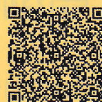
オンライン申請フォーム